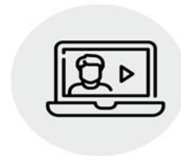
poradnictwo zawodowe na odległość